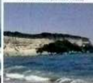
Monumento Natural Cabo Francés Viejo