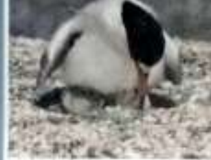
Habí (Sterna antillarum)

Nuestros Océanos reverdecen nuestro futuro