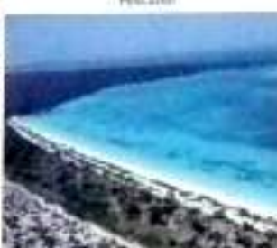
Baño de los Aguilóns