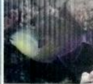
Pez Parrotfish ( Parrotfish )