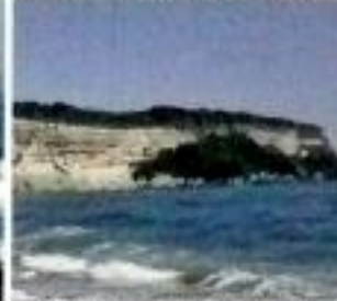
Monumento Natural Cabo Francés Viejo