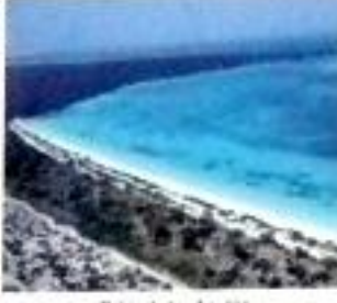
Baño de las Aguafías