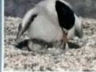
Bobo ( Sterna arctica )

Nuestros Océanos reverdecen nuestro futuro