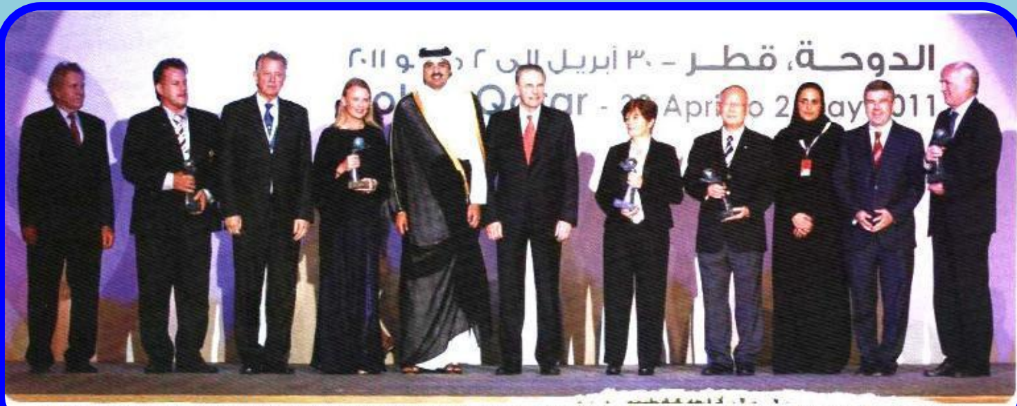
El Emir de Qatar junto al Presidente del Comité Olímpico Internacional y al presidente de Hungría, entre otros dirigentes internacionales