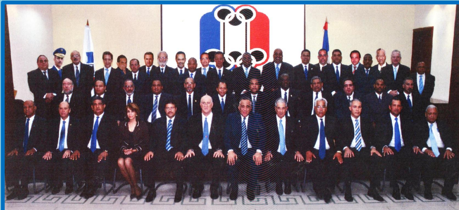
Miembros Asamblea Delegados Comité Olímpico Dominicano MAYO 2011